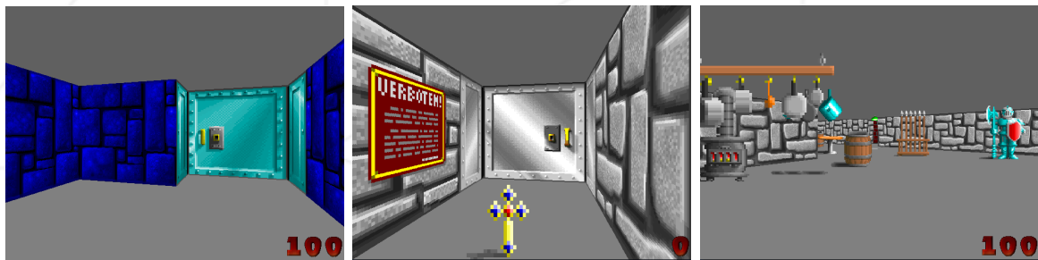
FIGURE VI.1 – Wolfenstein3D Jeu original utilisant le ray-casting.