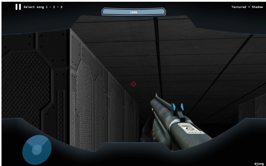
FIGURE VI.5 – Autre exemple de partie bonus avec une arme de votre choix et le joueur qui regarde le plafond