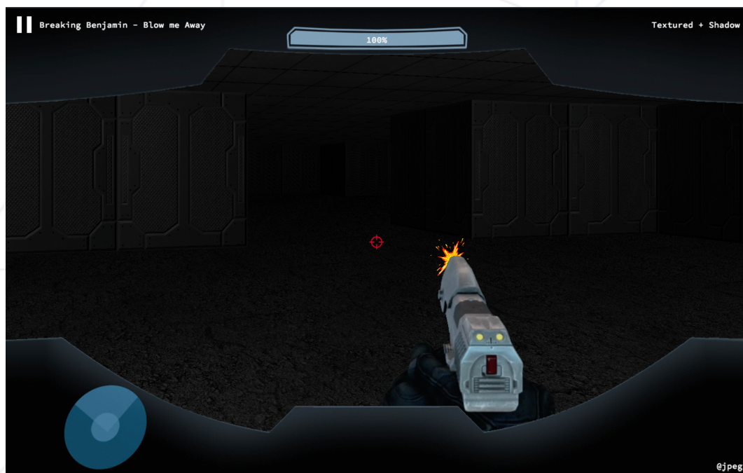
FIGURE VI.4 – Un autre exemple de bonus avec un HUD, une barre de vie, un effet d'ombre et une arme qui peut tirer