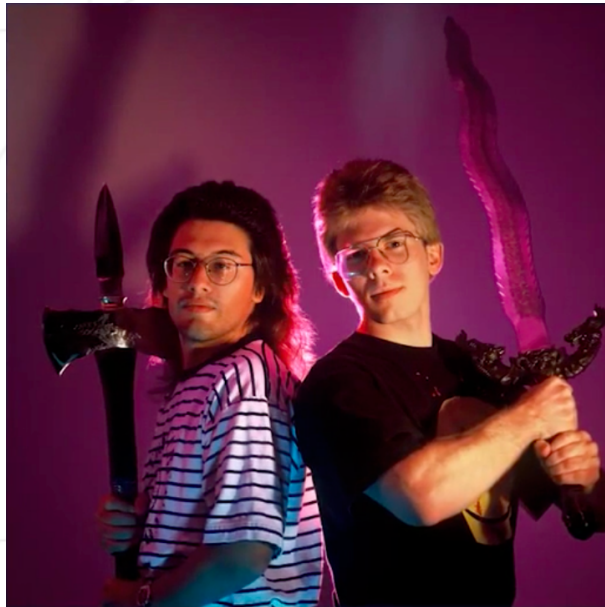
FIGURE I.1 – John Romero (gauche) et John Carmack (droite) posant pour la postérité

Développé par ID Software et les ultra-célèbres John Carmack et John Romero, publiée en 1992 par Apogee Software, Wolfenstein 3D est le premier "First Person Shooter" dans l'histoire du jeu-vidéo.